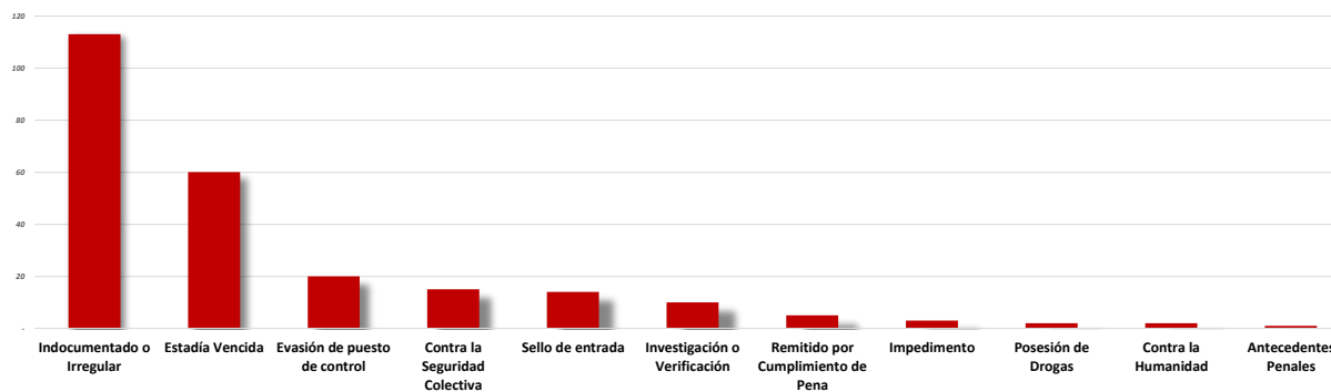
Gráfico No. 3 EXTRANJEROS CON ESTATUS IRREGULAR Y FALTAS A LA LEGISLACIÓN ADMINISTRATIVA Y PENAL REMITIDOS POR RAZÓN: AÑO 2020

Cifras preliminares actualizadas al 30 de abril de 2020.